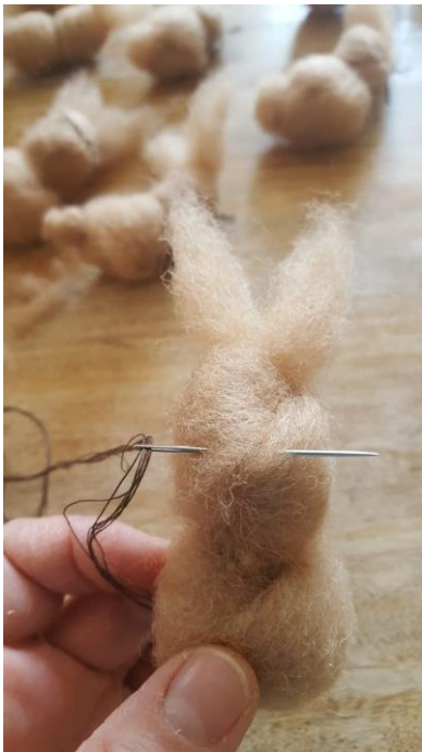
Mit einem sechsfachen Bindfaden die Schnurbarthaare einstechen.