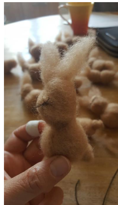
...und fertig ist der Hase!