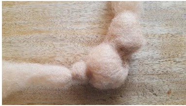
Einen dritten winzigen Knoten für's Schwänzchen.