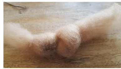
Einen zweiten größeren Knoten für den Bauch.