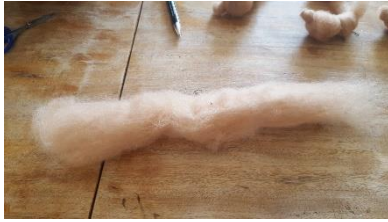
Wollstrang aus Märchenwolle.