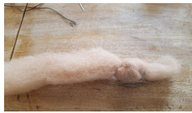
Ein Knoten für den Kopf .